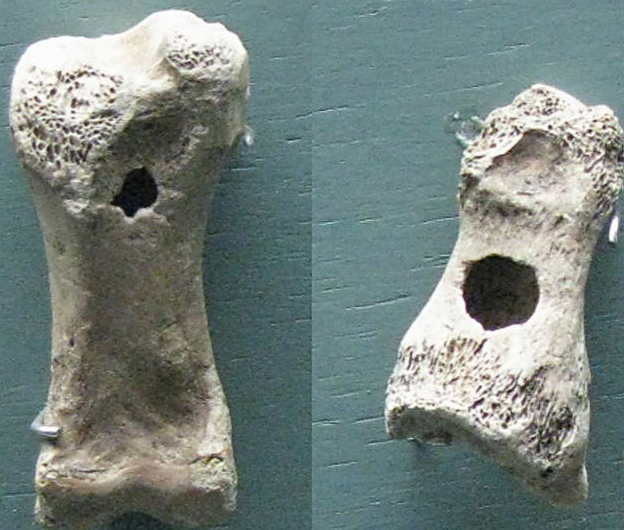
Fløytar laga av reinsdyrbein.

Det eldste musikkinstrumentet vi kjenner til, er fløyter laga av bein frå gåsegribb og mammut. Desse 35 000 år gamle fløytene, vart funne i ei hule i Tyskland. Fløyta er som eit røyr og har fleire utskorne hol. Ulike melodiar kunne spelast ved å dekkje til eller opne hola med fingrane. Desse fløytene viser at menneske laga musikk lenge før dei byrja å skrive.