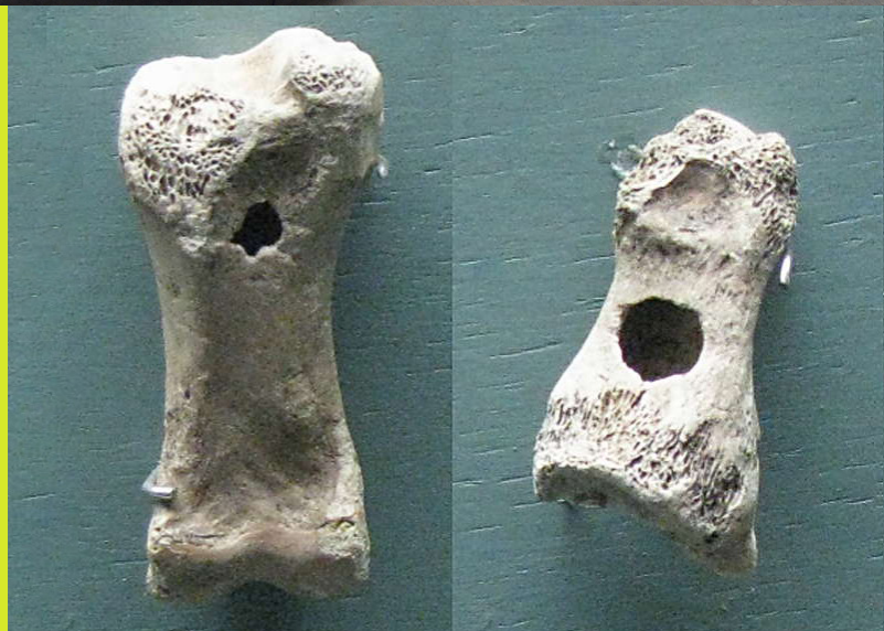
Fløyter laget av reinsdyrbein.

Det eldste instrumentet vi har funnet, er fløyter laget av dyrebein. De er funnet i en hule i Tyskland.